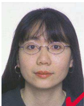
No. 5: anteojos OK