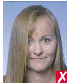
No. 3: el cabello no debe cubrir los ojos