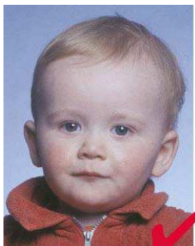
No. 4: los niños deben cumplir con los mismos requisitos que los adultos