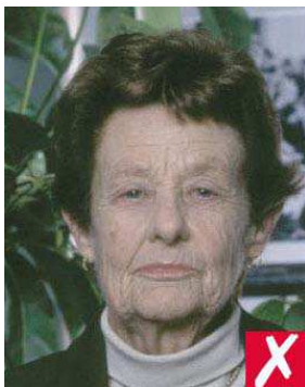
No. 1: el fondo debe ser uniforme