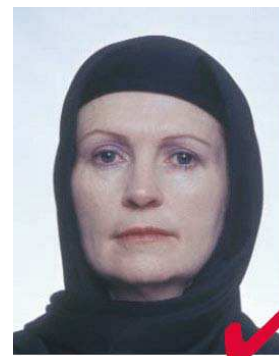
No. 6: prendas para la cabeza por motivos religiosos aprobadas